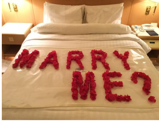
ベッドフラワー 文字のみ