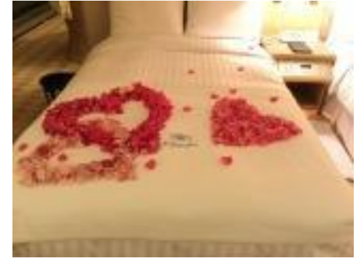
ベッドフラワー ハート3