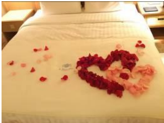
ベッドフラワー ハート2