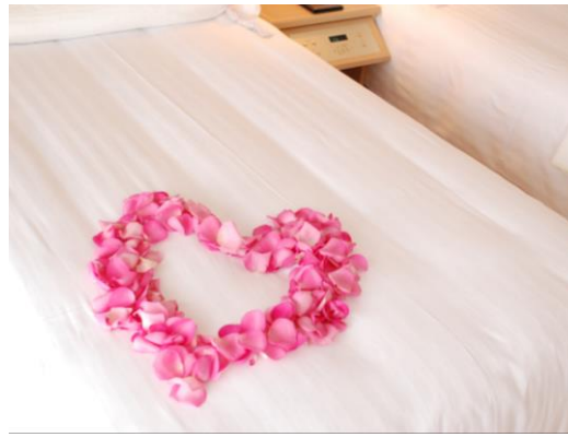
ベッドフラワー ハート1