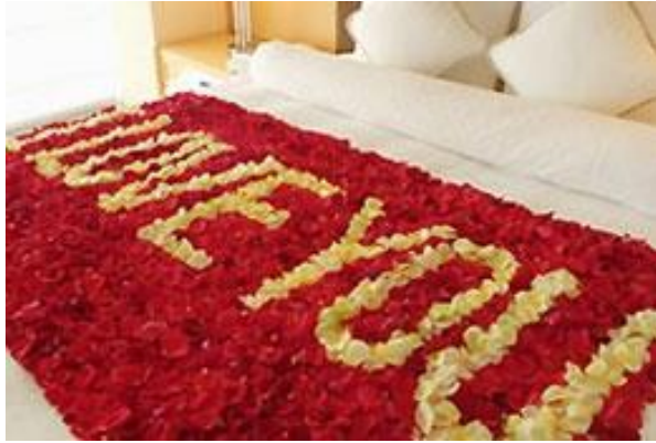
ベッドフラワー 文字と背景