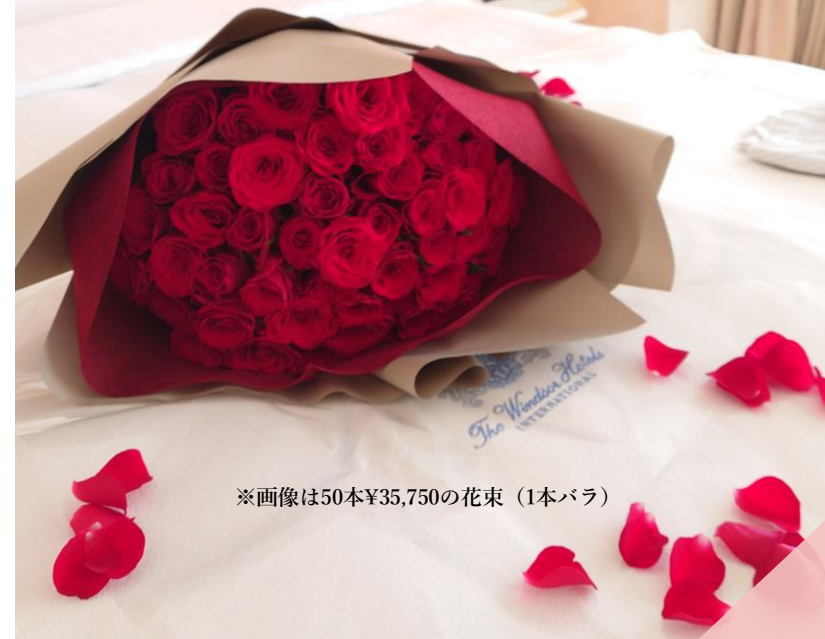
※画像は50本¥35,750の花束 (1本バラ)